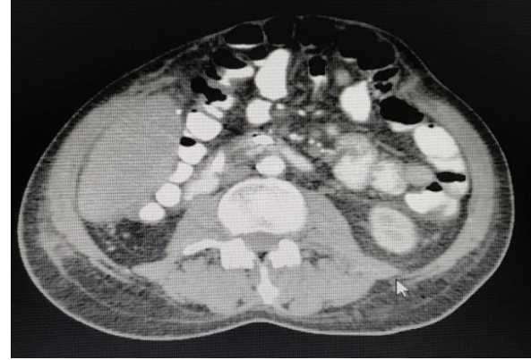
Şekil 1. Oral ve intravenöz kontrastlı tüm batin bilgisayarlı tomografisi (Tüm Batin BT)